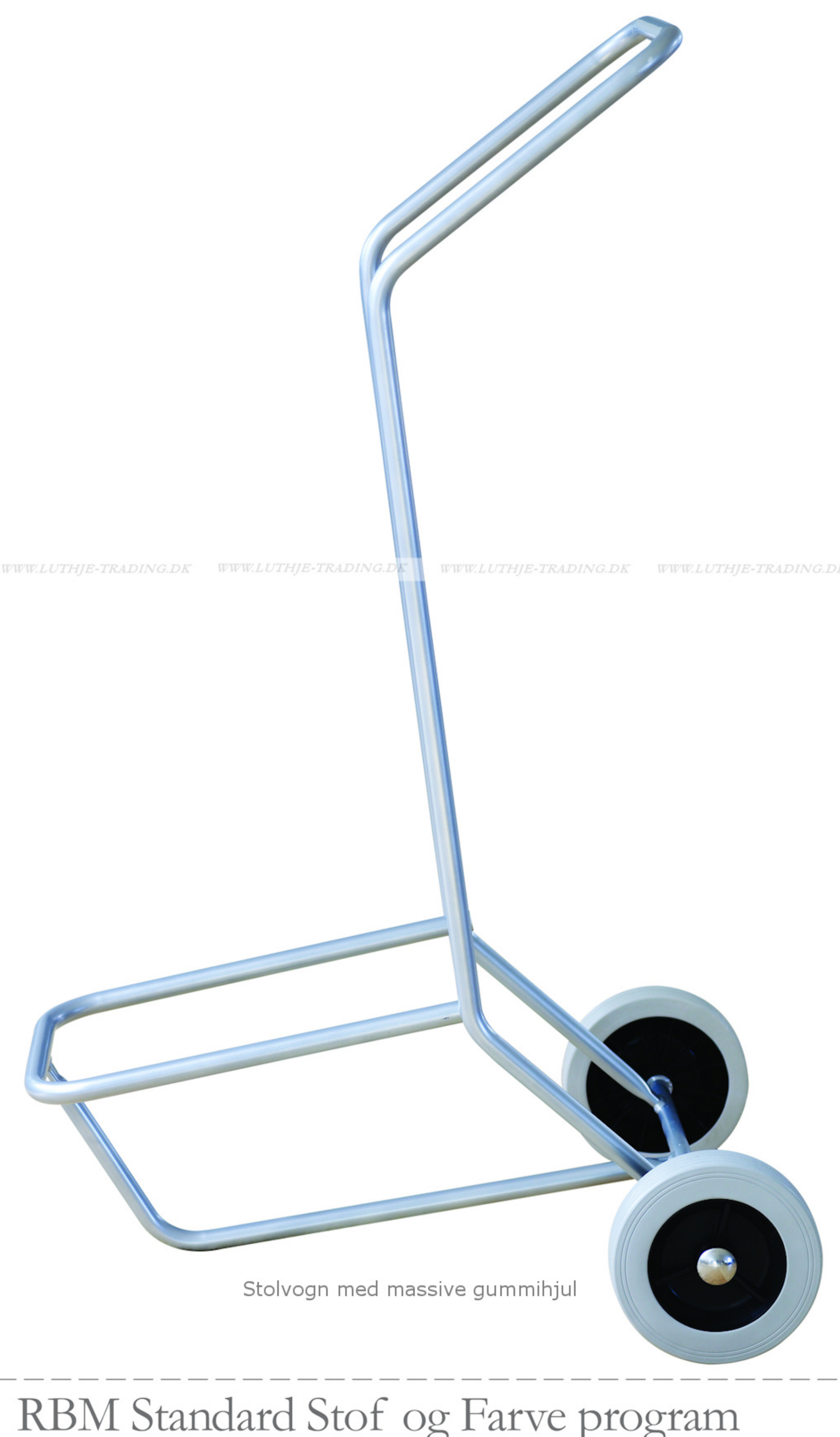
Stolvogn med massive gummi hjul