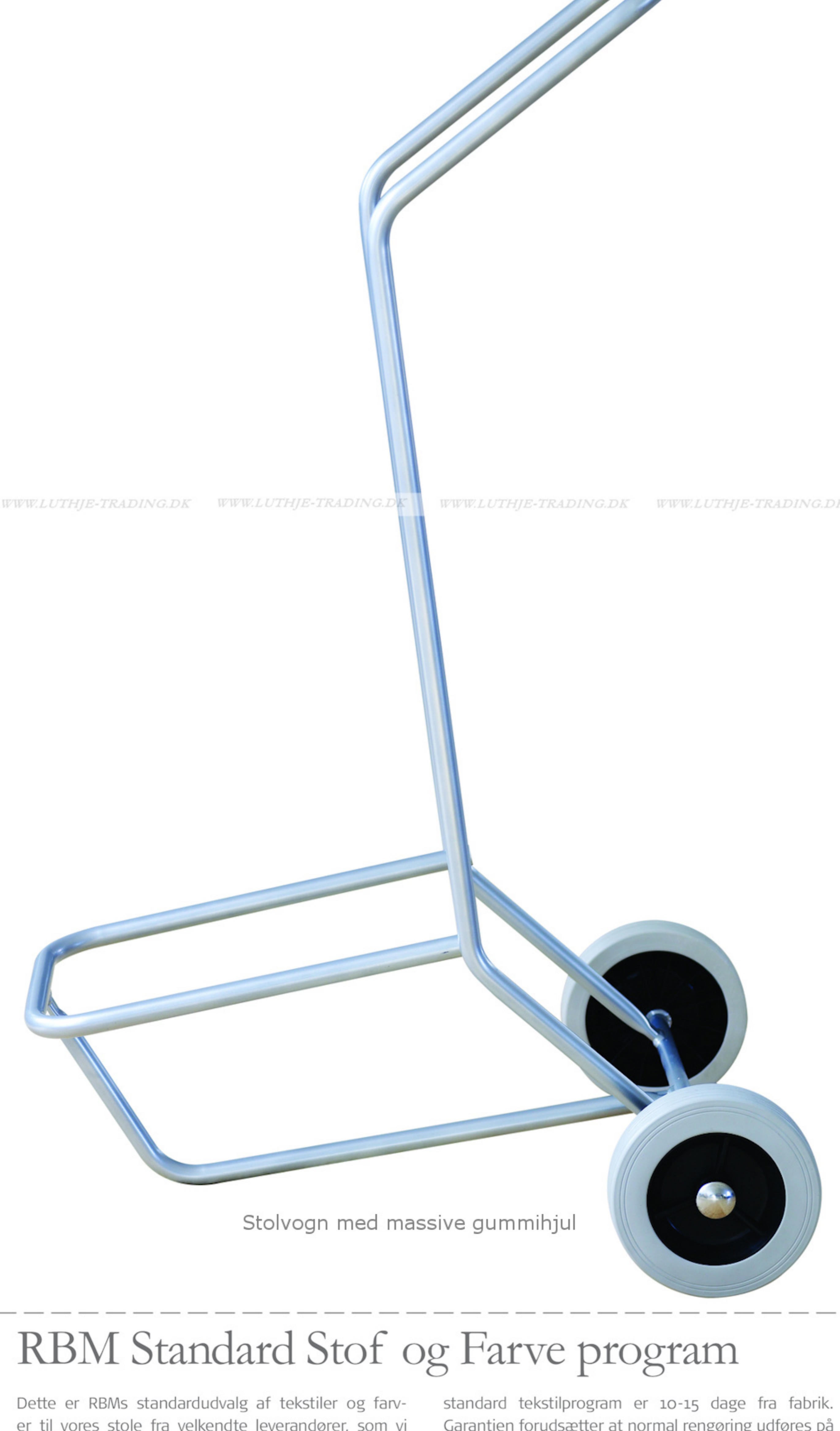
Stolvogn med massive gummihjul