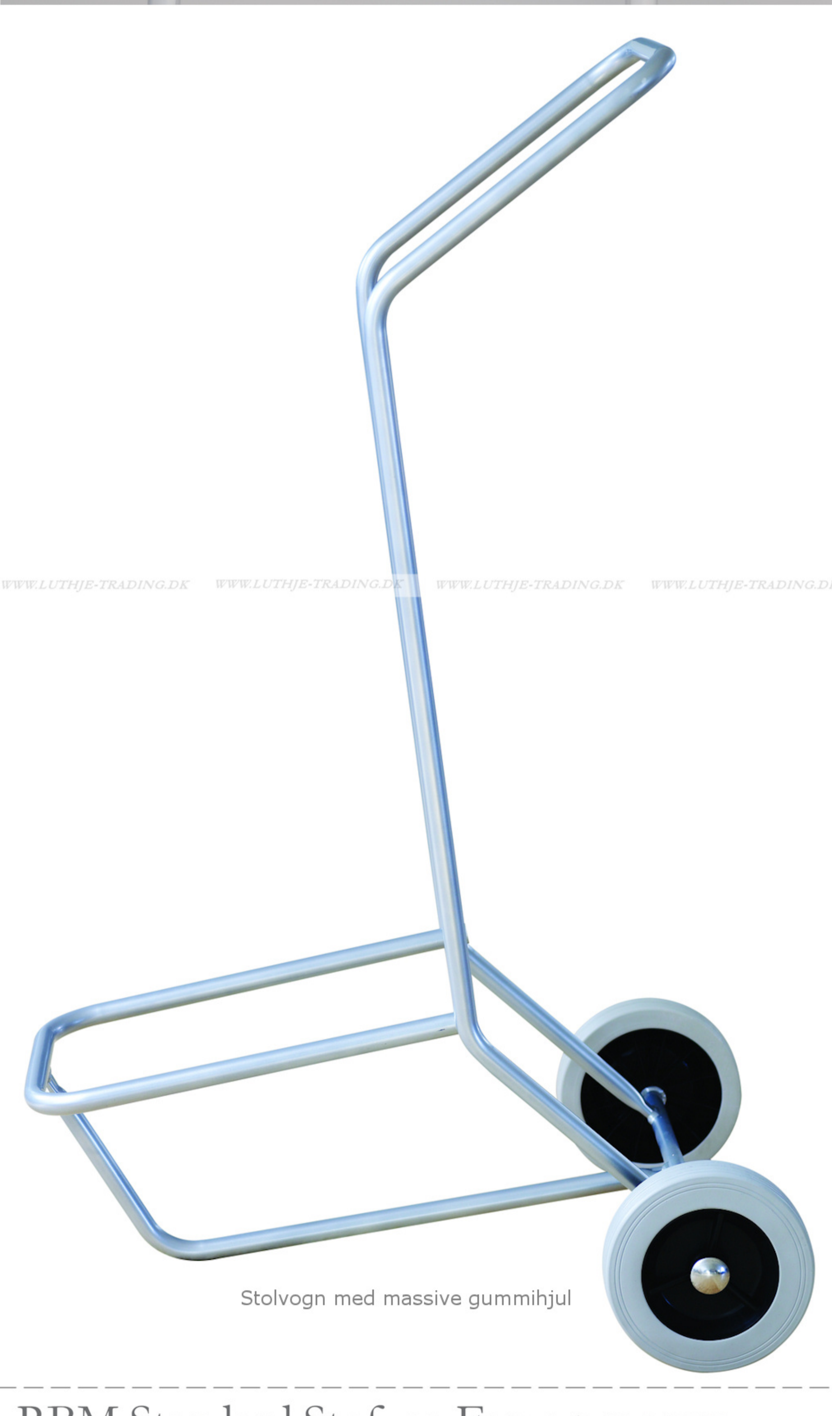
Stolvogn med massive gummihjul