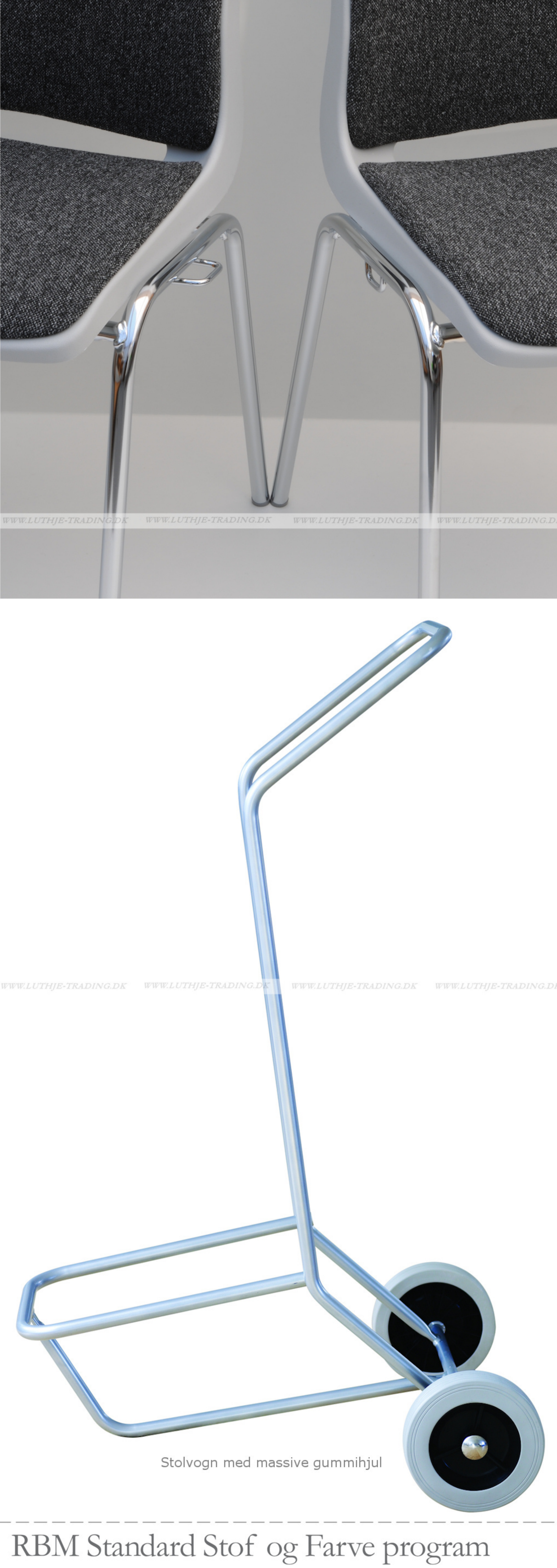
Stolvogn med massive gummihjul