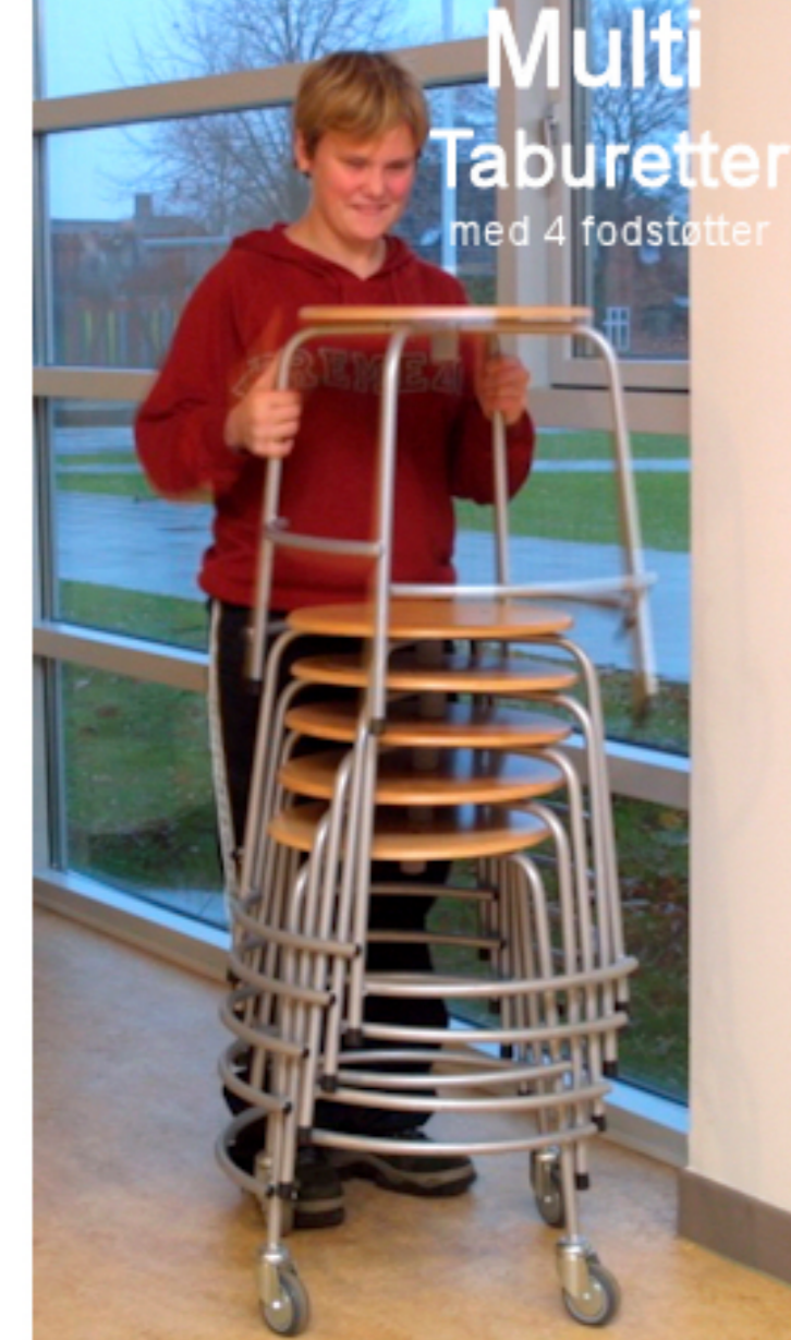
Multi Taburetter med 4 fodstatter