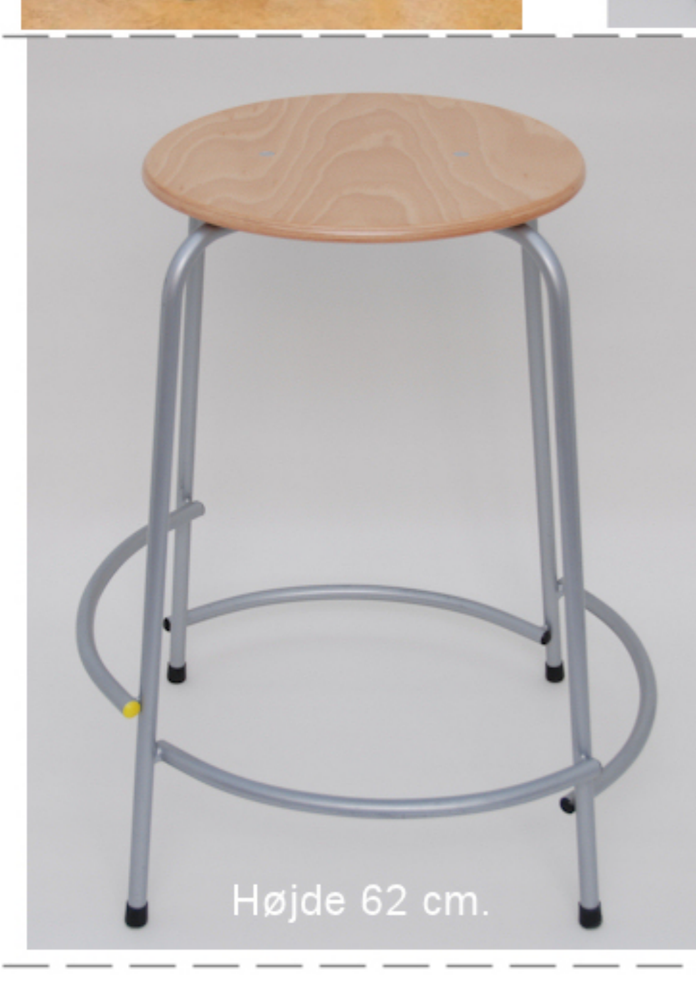
Højde 62 cm.