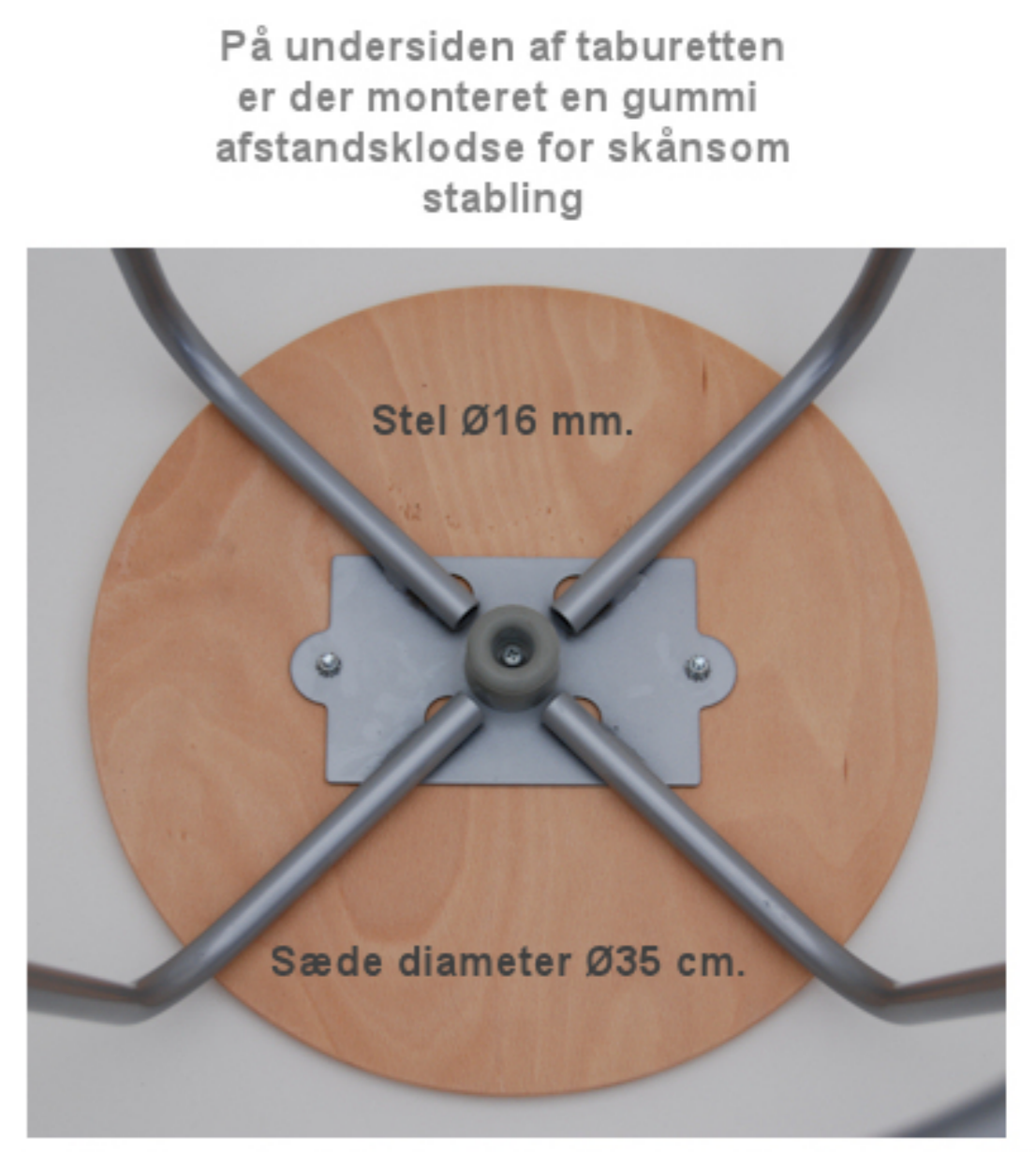
På undersiden af taburetten er der monteret en gummi afstandsklodse for skånsom stabling