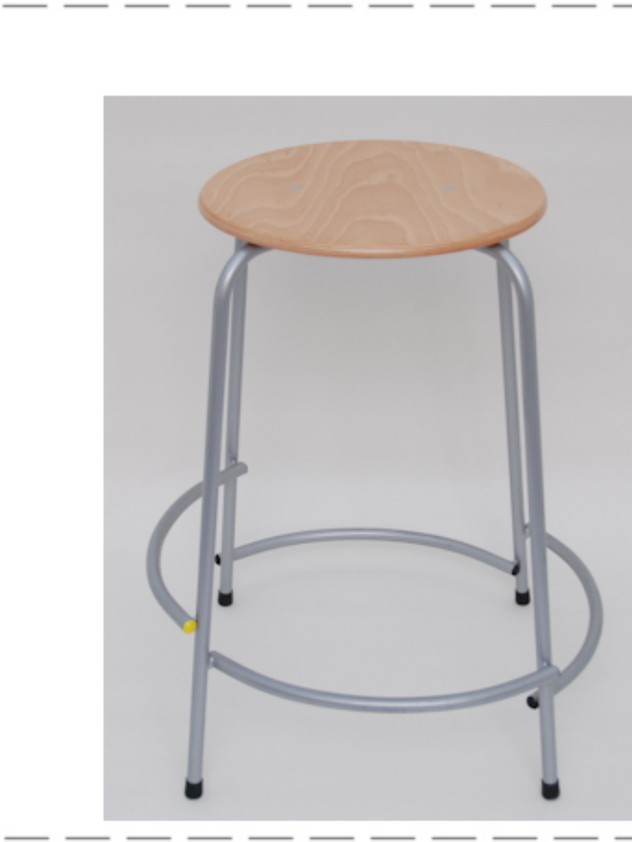
Kan leveres med: Sæde i bøg, birk eller PUR gummi Stel i alu eller sort pulverlakeret