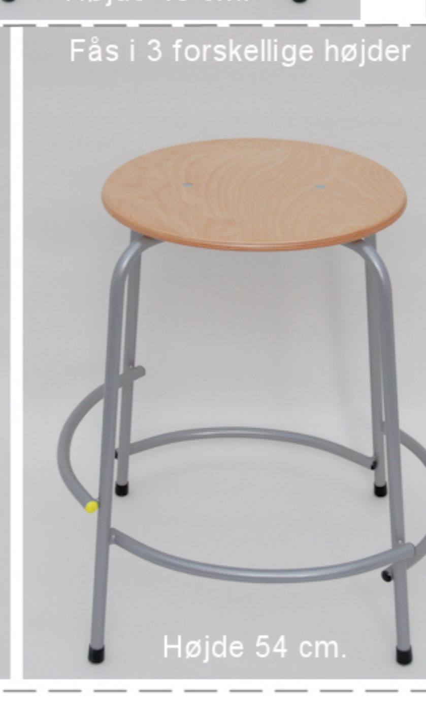
Højde 54 cm.