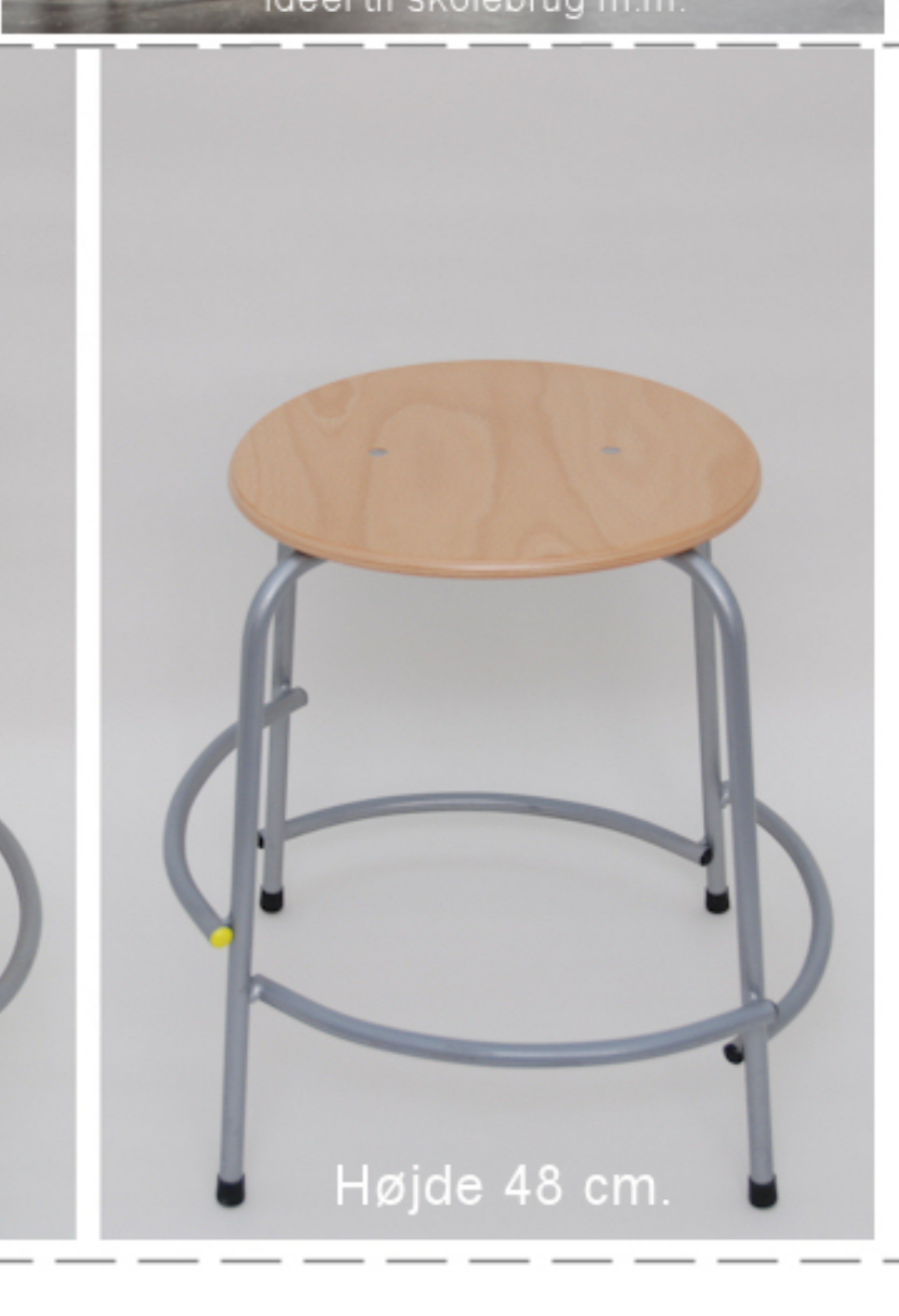
Højde 48 cm.