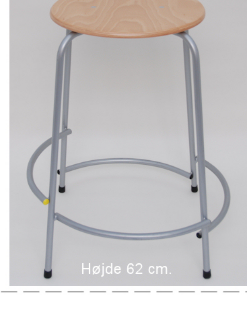
Højde 62 cm.