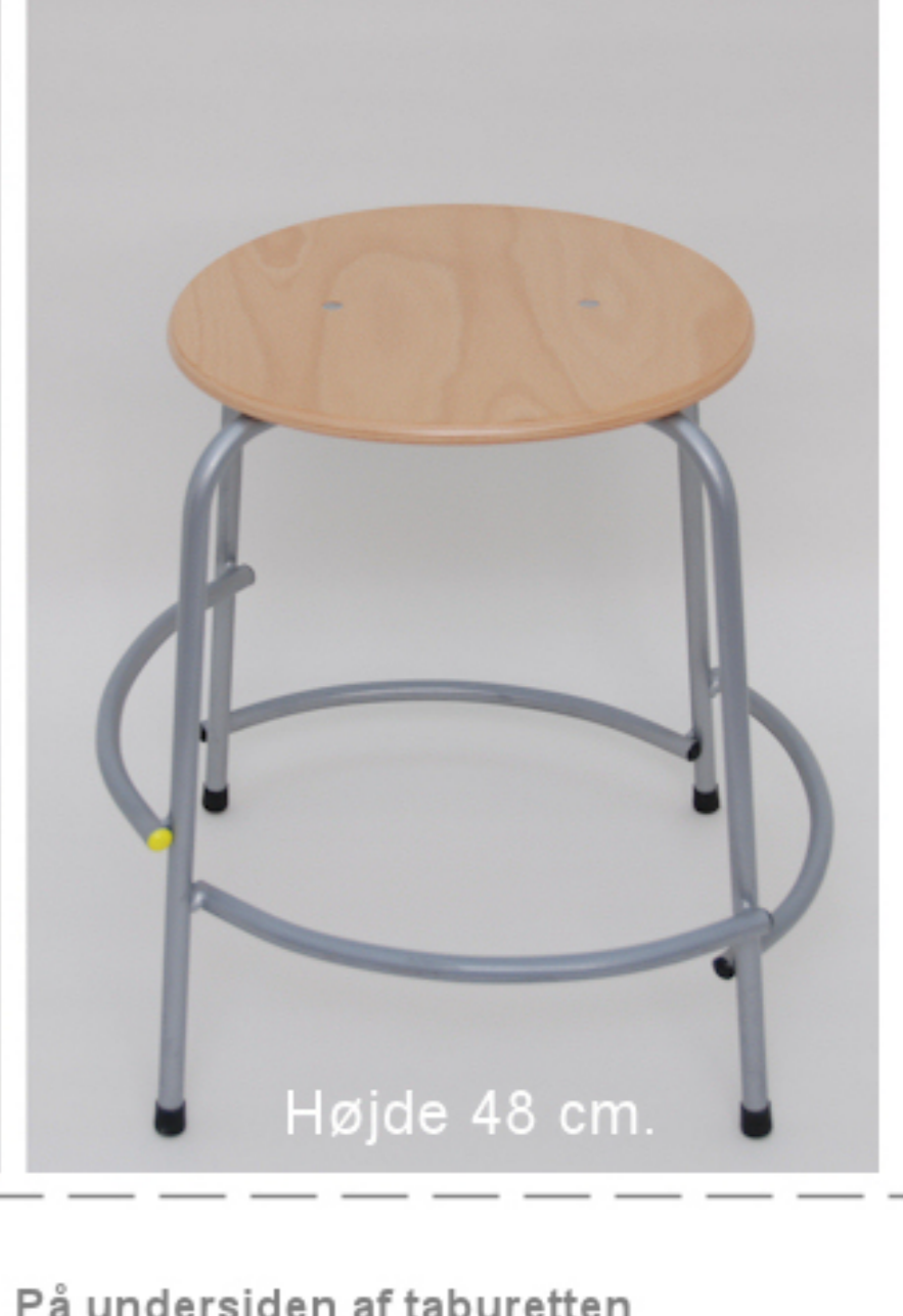
Højde 48 cm.