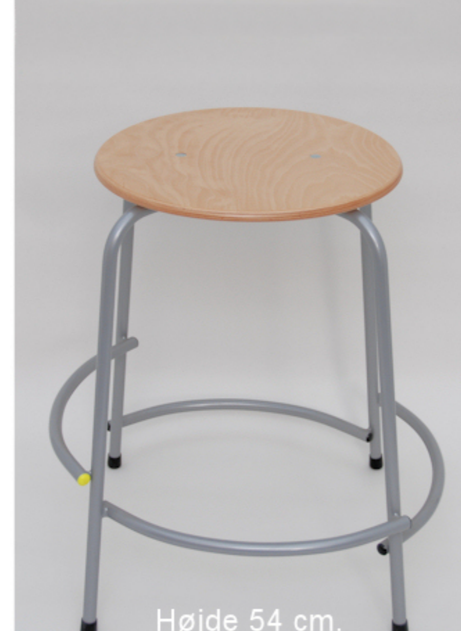
Højde 54 cm.