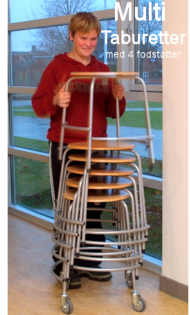
Multi Taburetter med 4 fodstatter