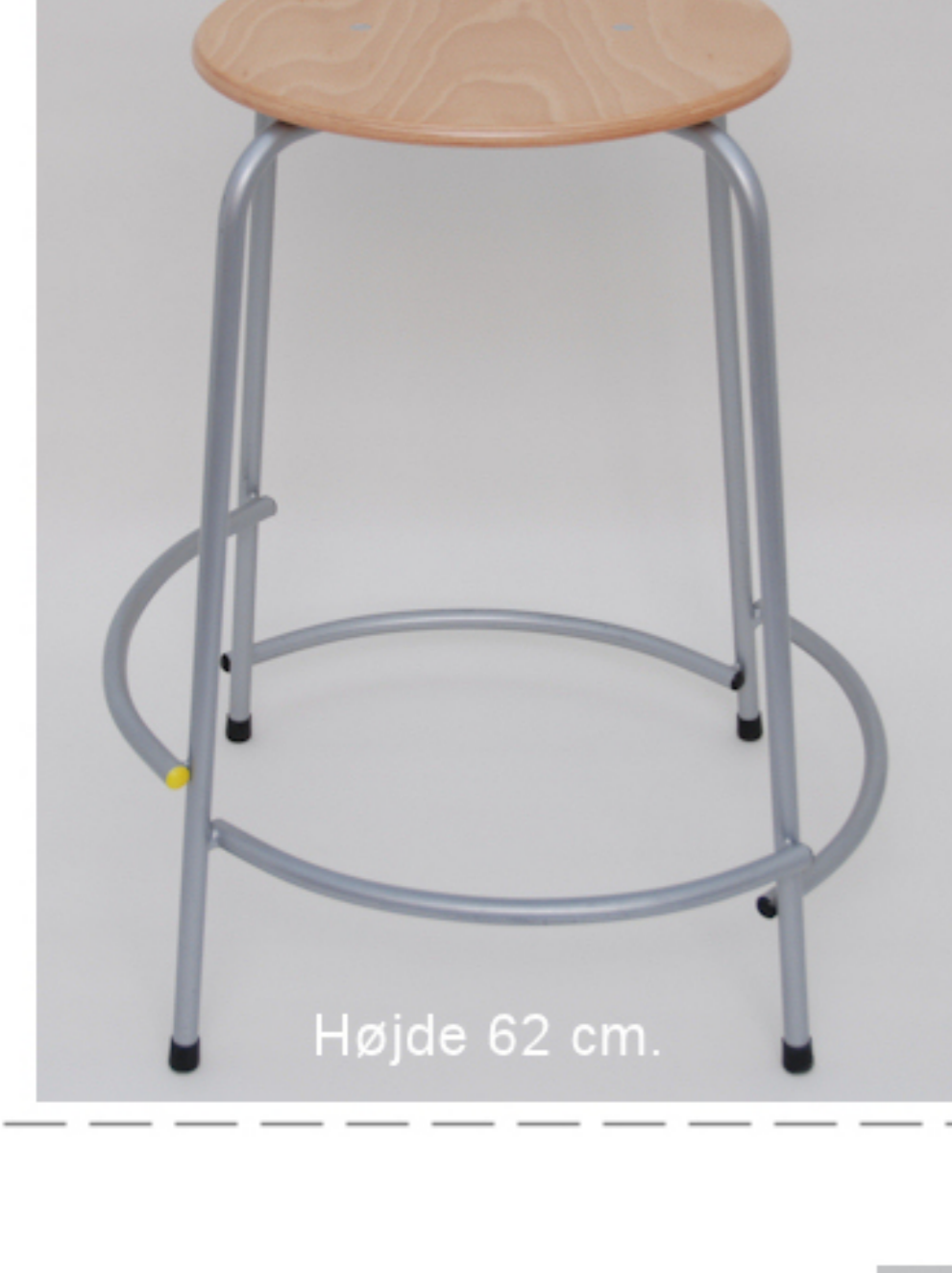
Højde 62 cm.