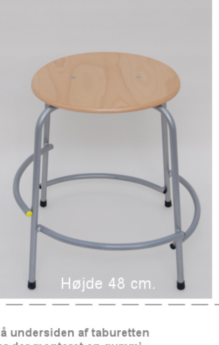
Højde 48 cm.