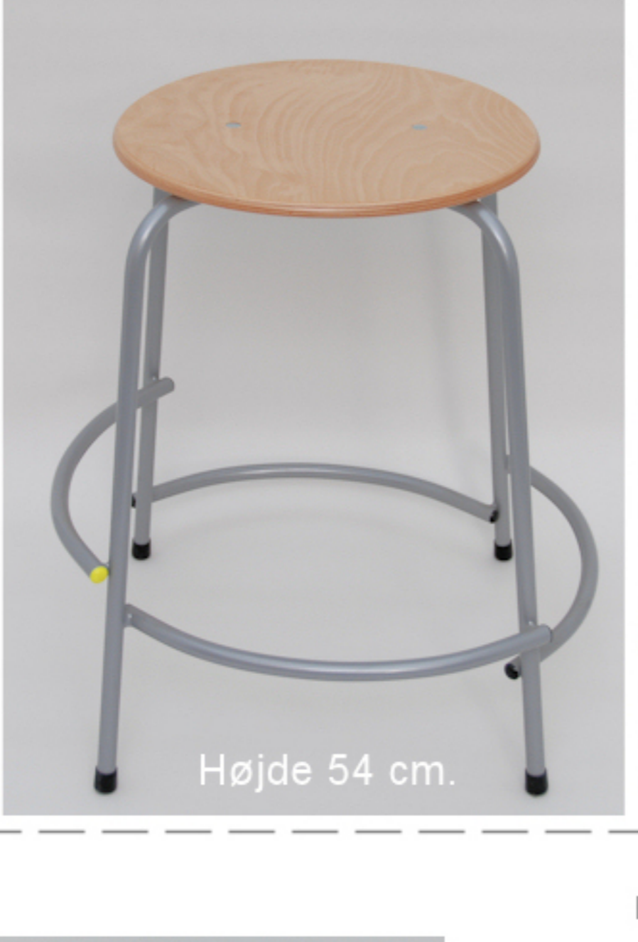
Fås i 3 forskellige højder