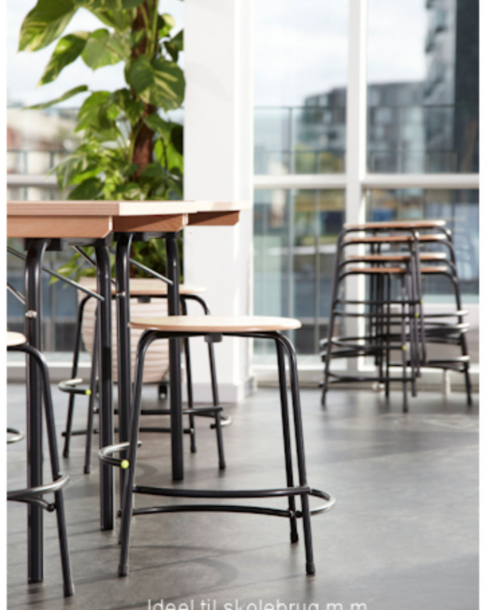
Ideel til skolebrug m.m.