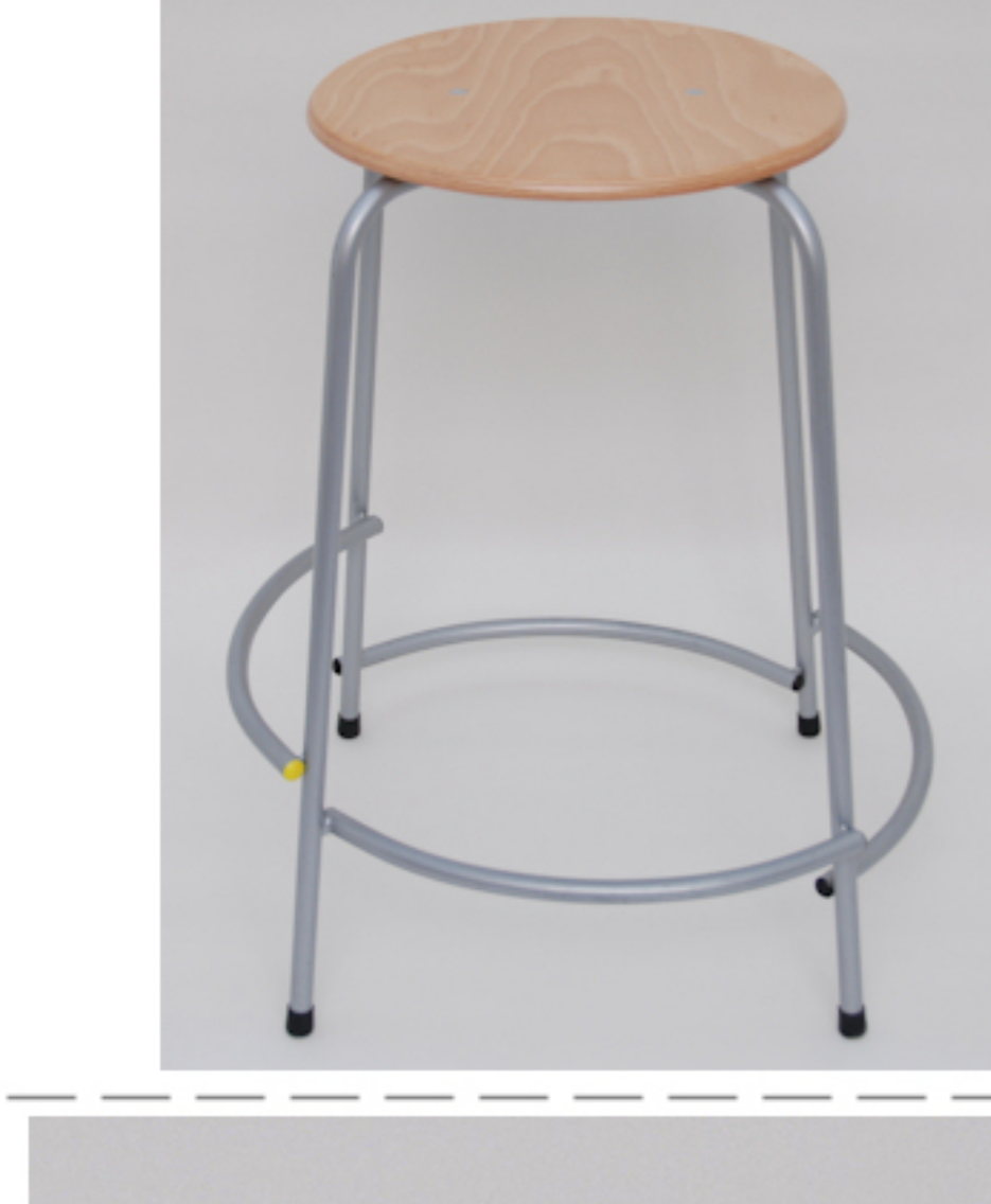
Kan leveres med: Sæde i bøg, birk eller PUR gummi Stel i alu eller sort pulverlakeret