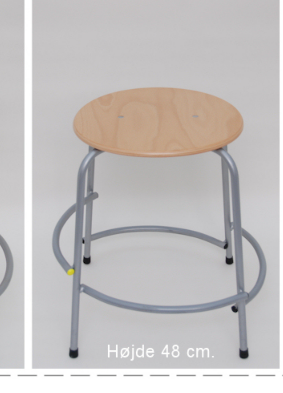
Højde 48 cm.