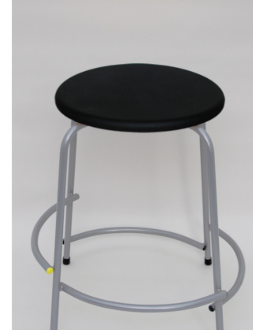
Højde 54 cm.