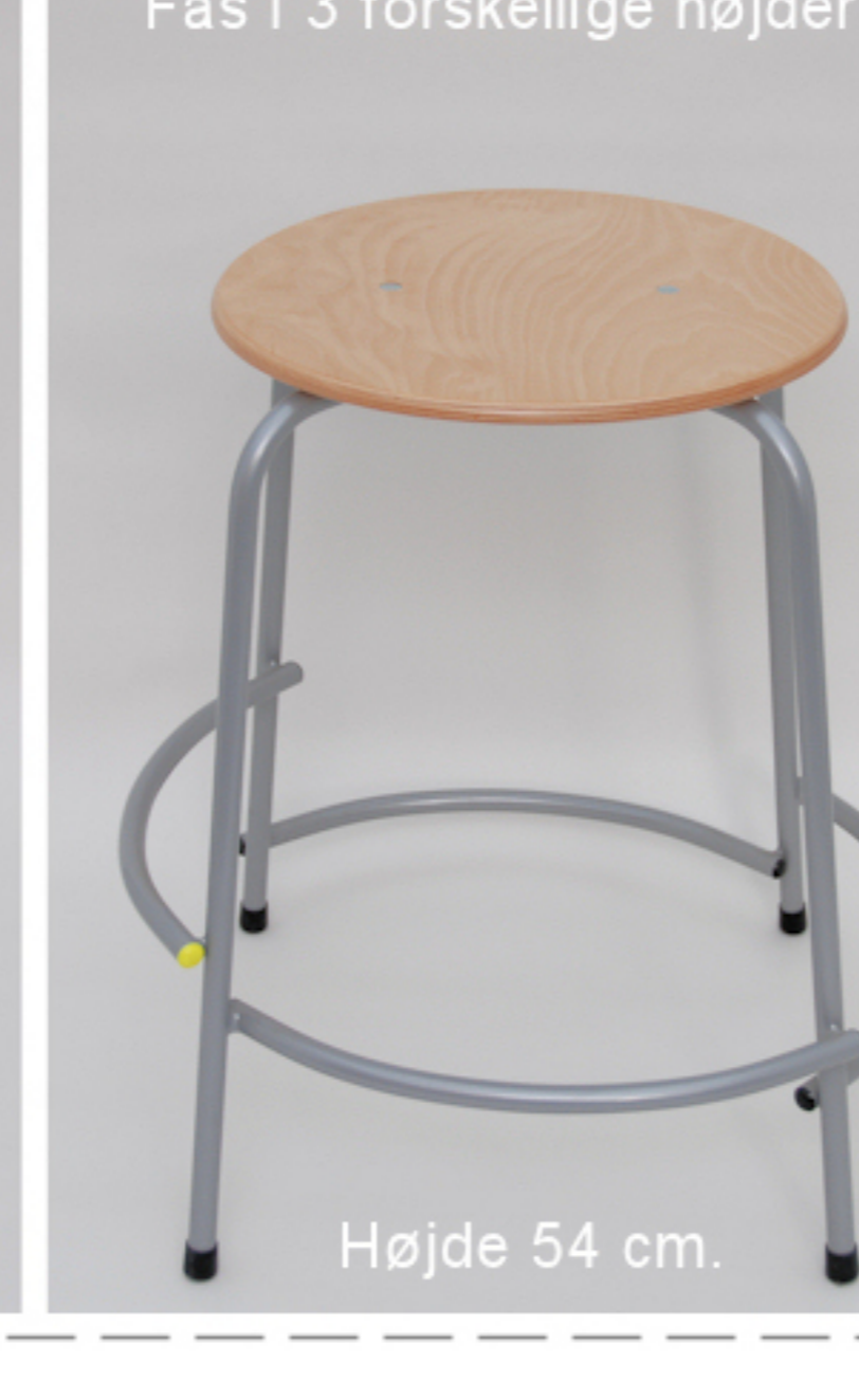
Fås i 3 forskellige højder