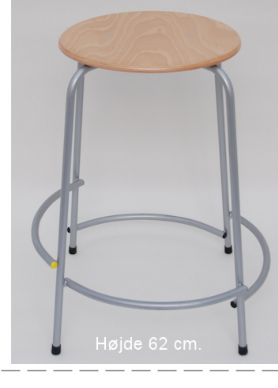
Højde 62 cm.