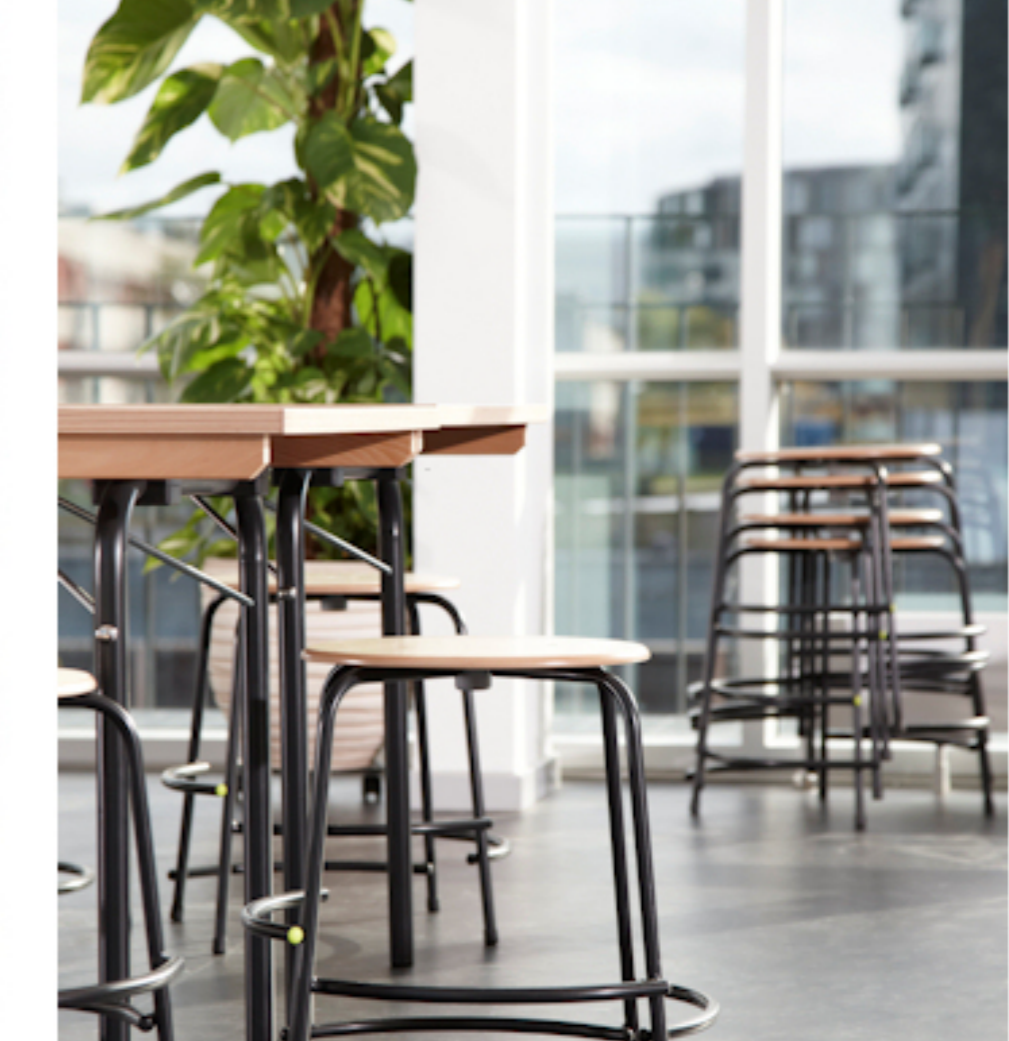
Ideel til skolebrug m.m.