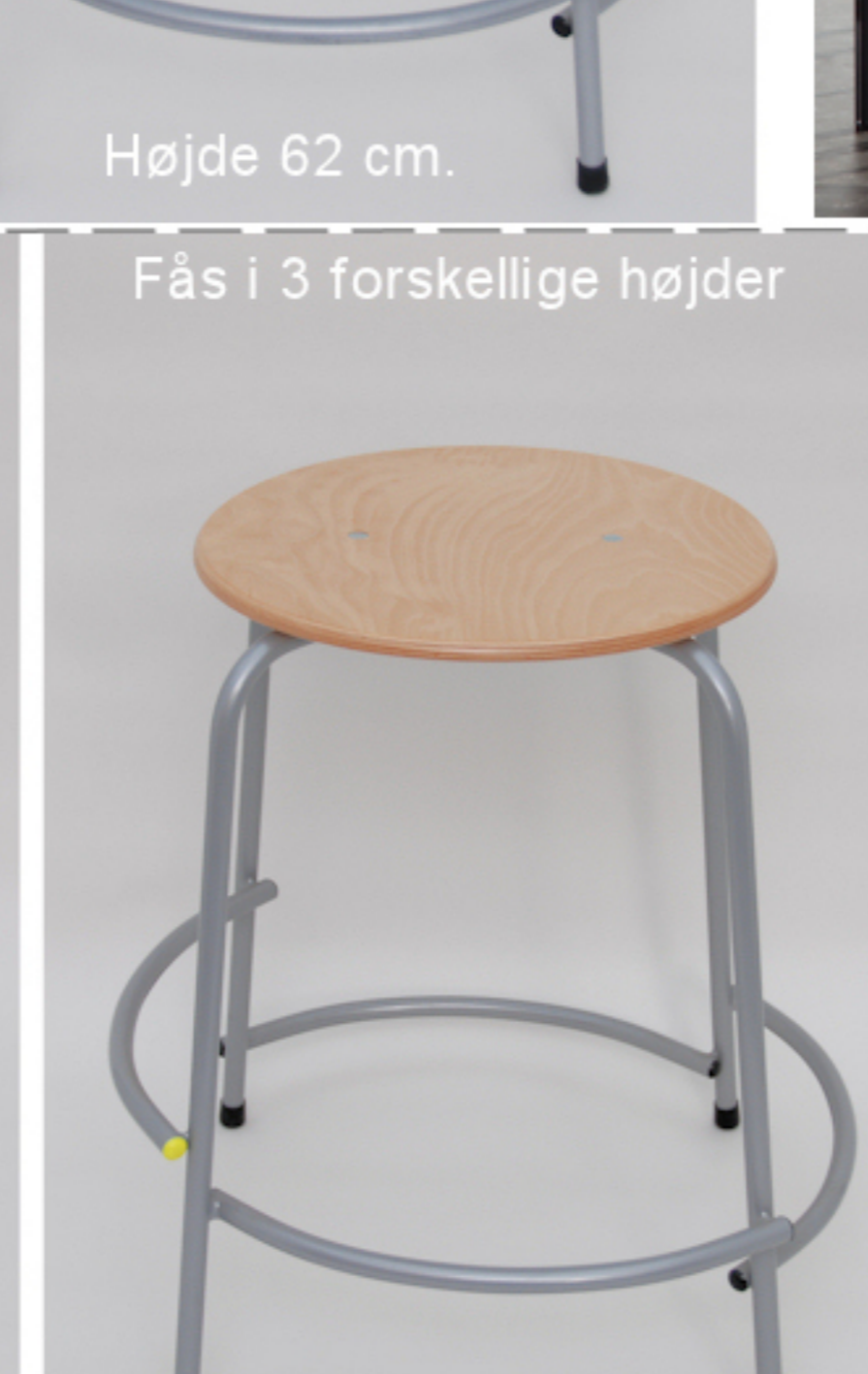
Højde 54 cm.