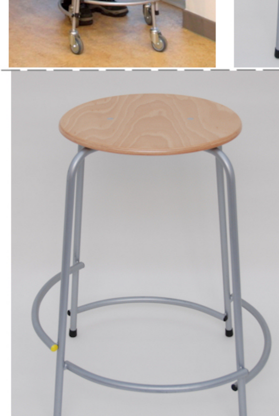
Højde 62 cm.