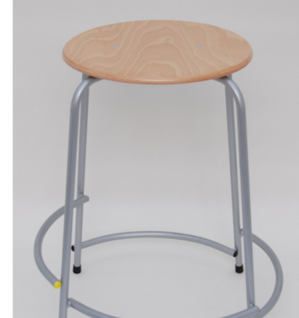
Højde 62 cm.