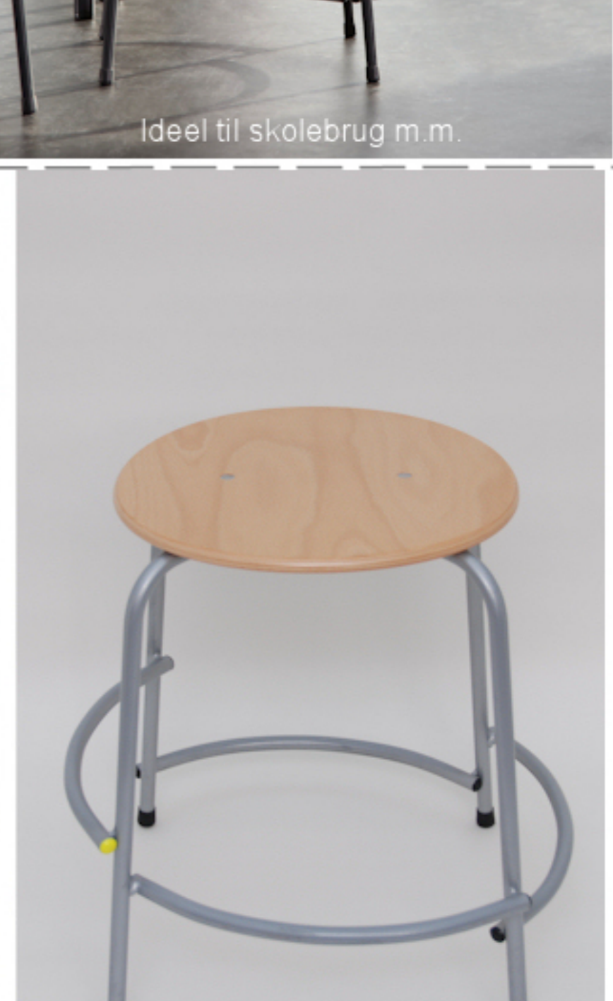
Højde 48 cm.