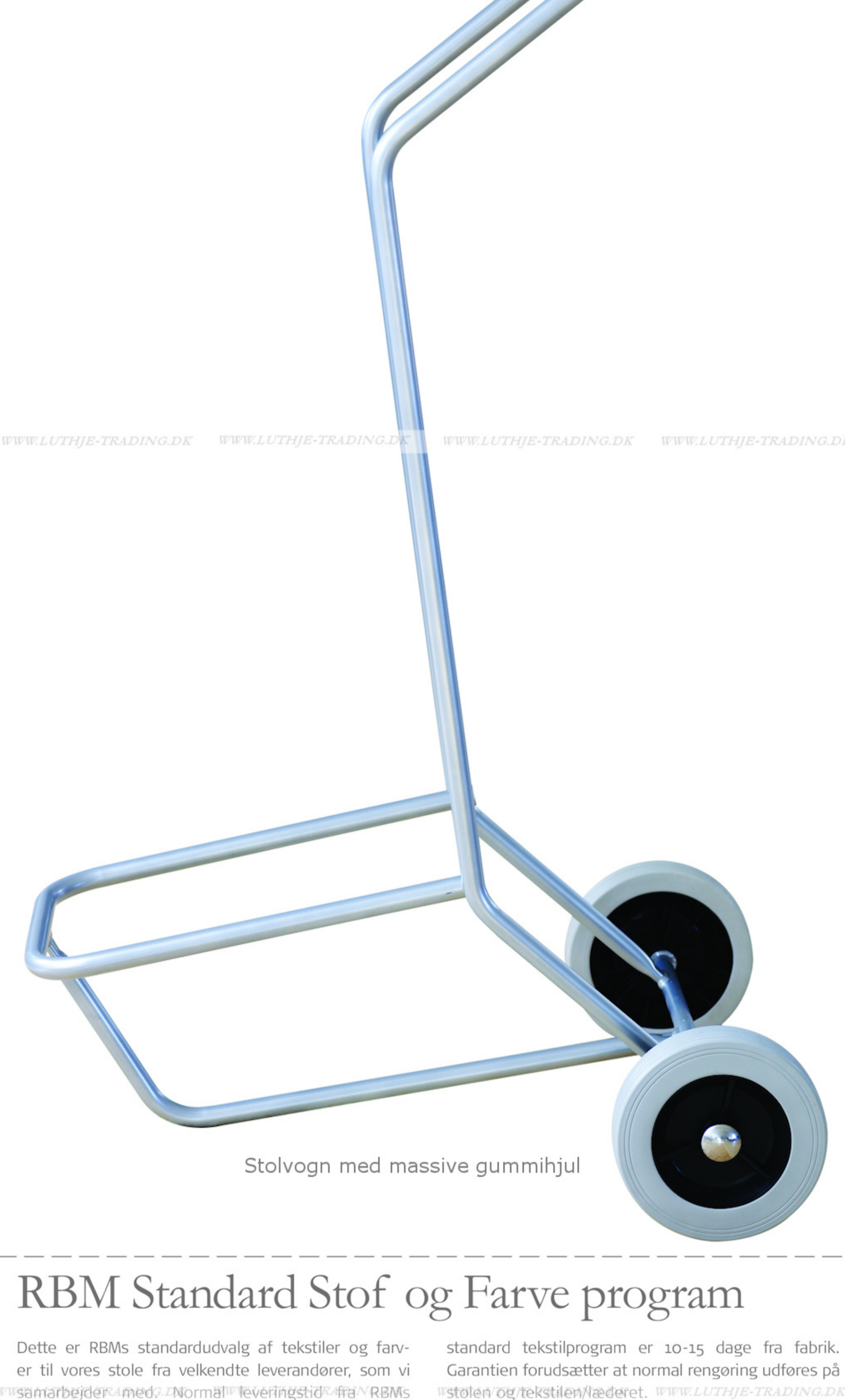
Stolvogn med massive gummi hjul