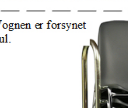
Fås med clips plastkobling i 2 størrelser

Stolvogn for nem transport og opbevaring. Vognen er forsynet med 2 drejelige hjul m/bremse, samt 2 faste hjul.