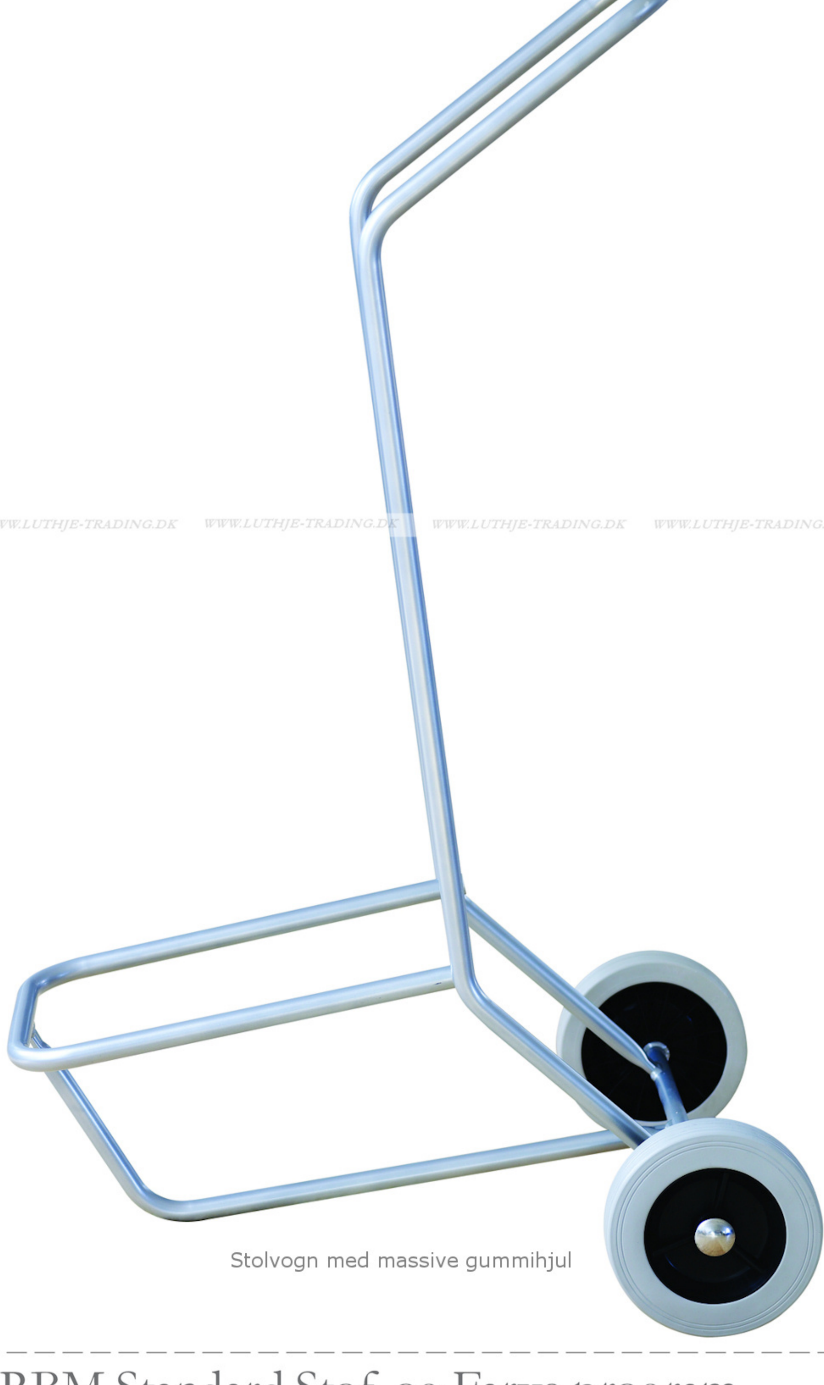
Stolvogn med massive gummihjul