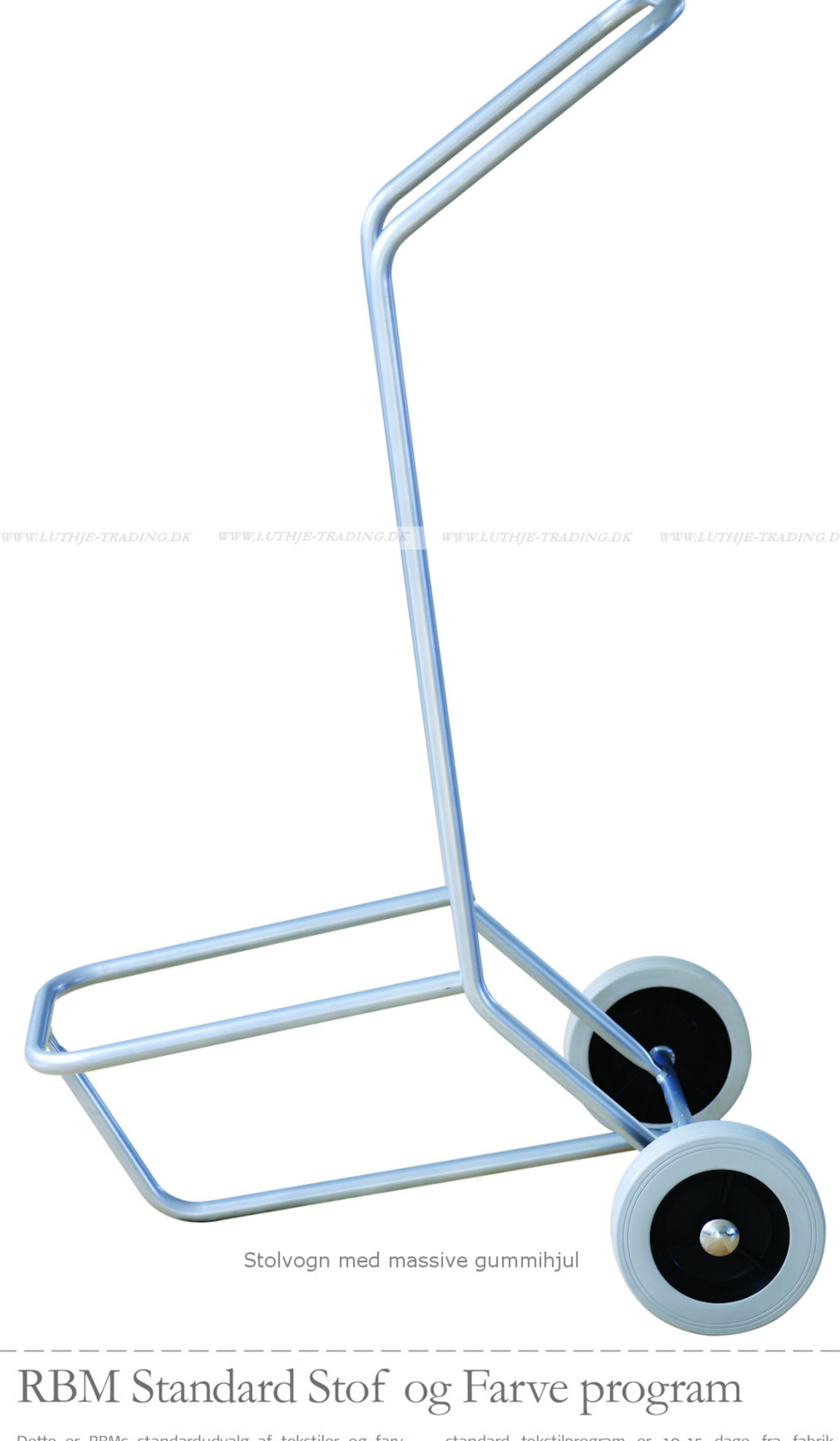
Stolvogn med massive gummihjul