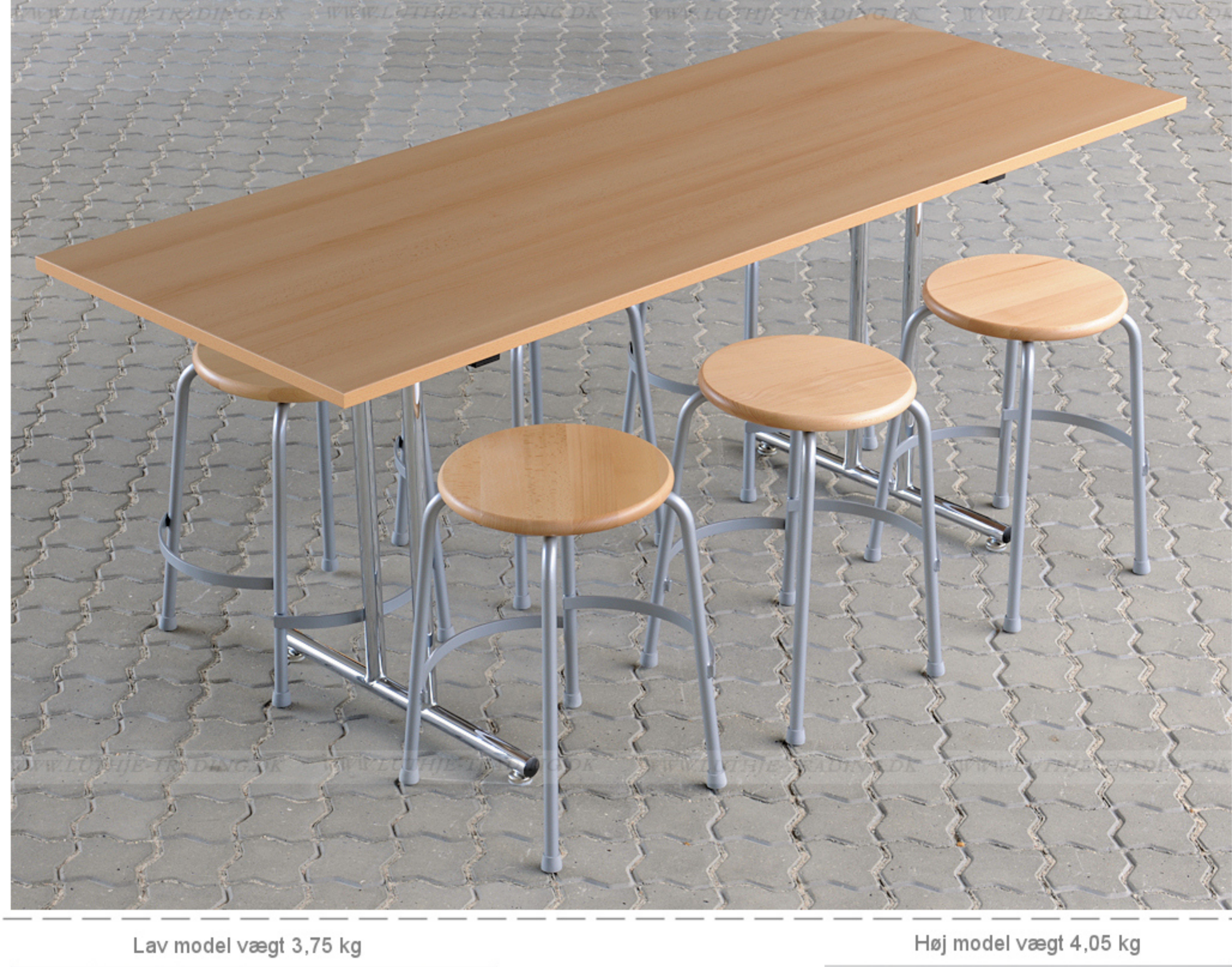
Lav model vægt 3,75 kg Høj model vægt 4,05 kg