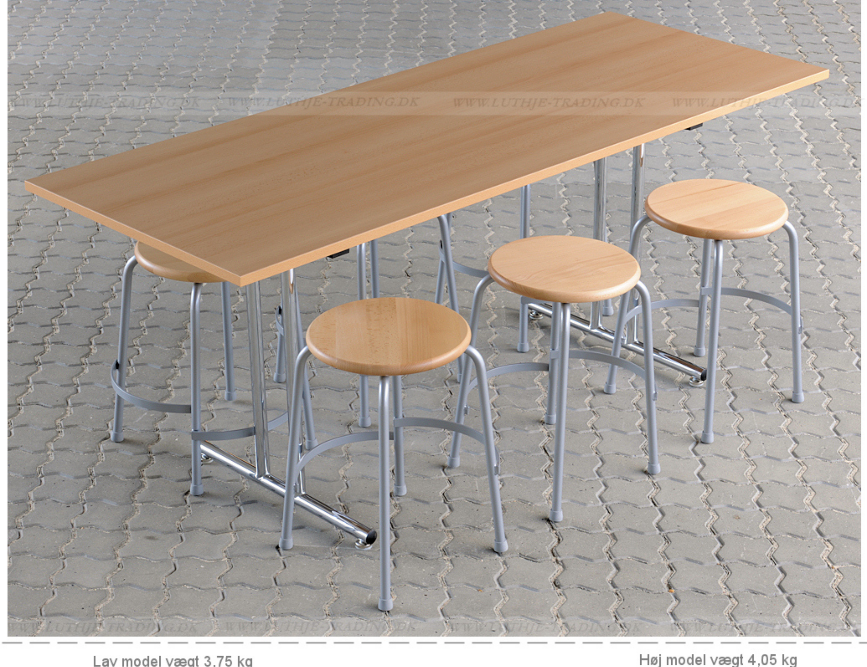
Lav model vægt 3,75 kg Høj model vægt 4,05 kg