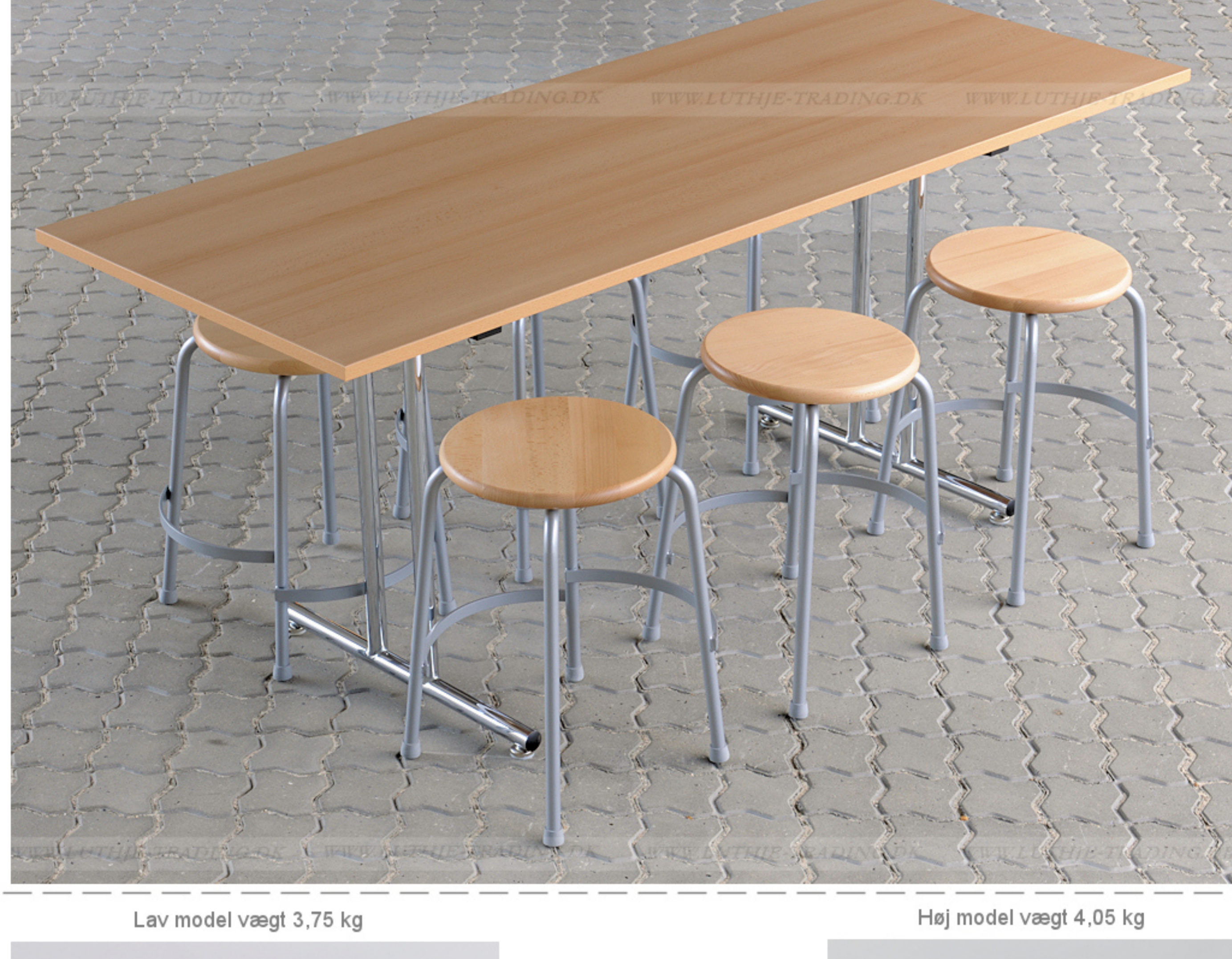
Lav model vægt 3,75 kg