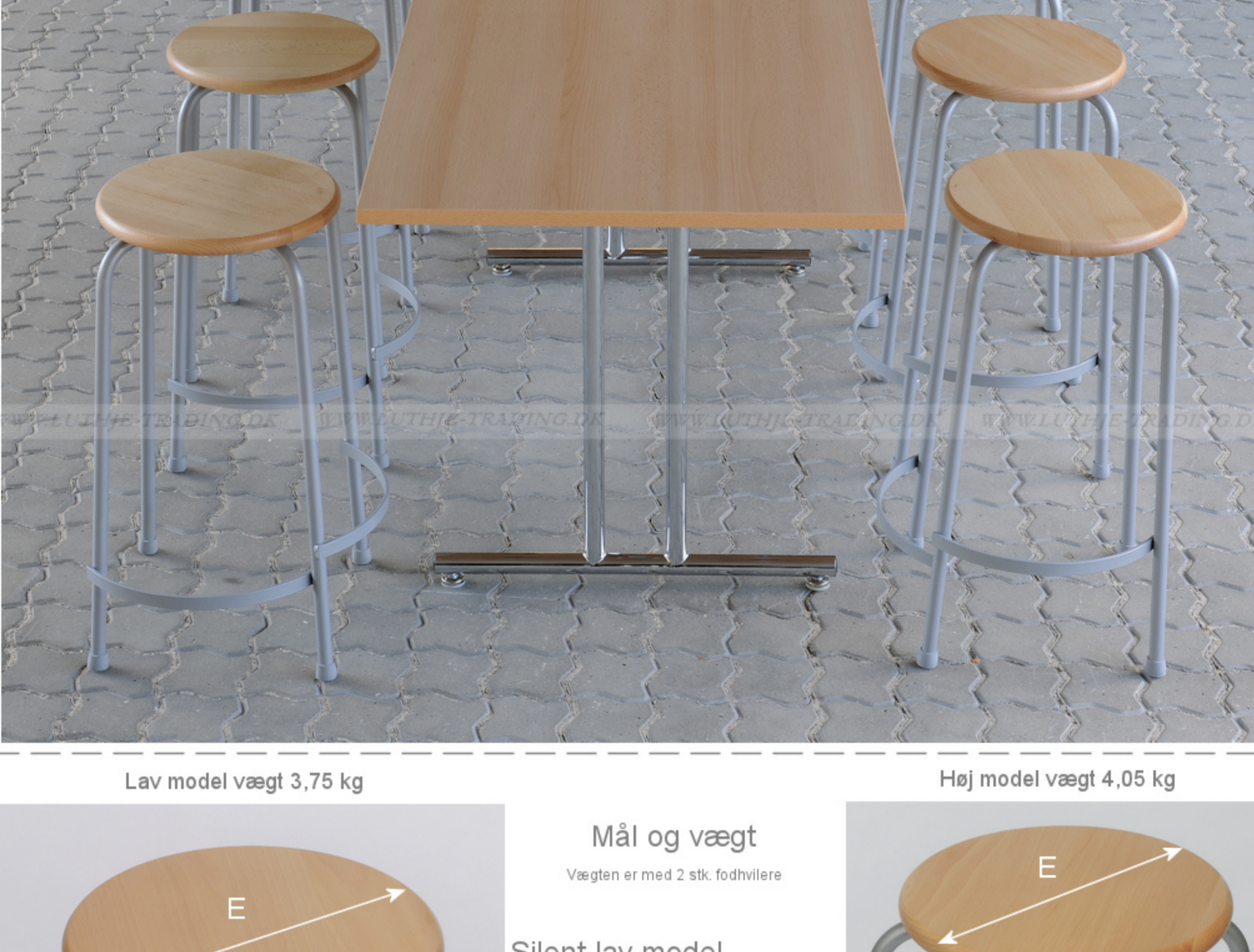
Lav model vægt 3,75 kg