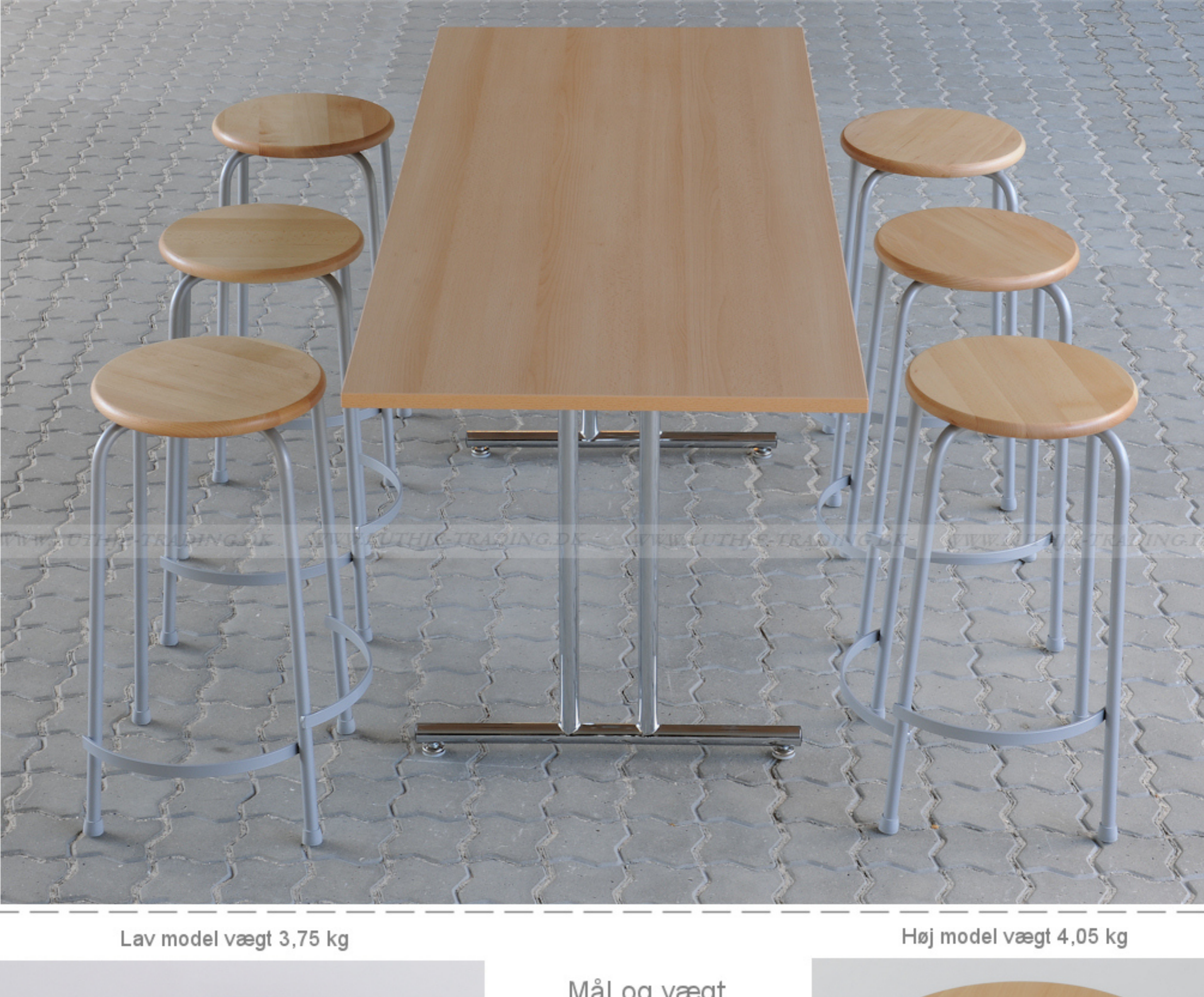
Lav model vægt 3,75 kg