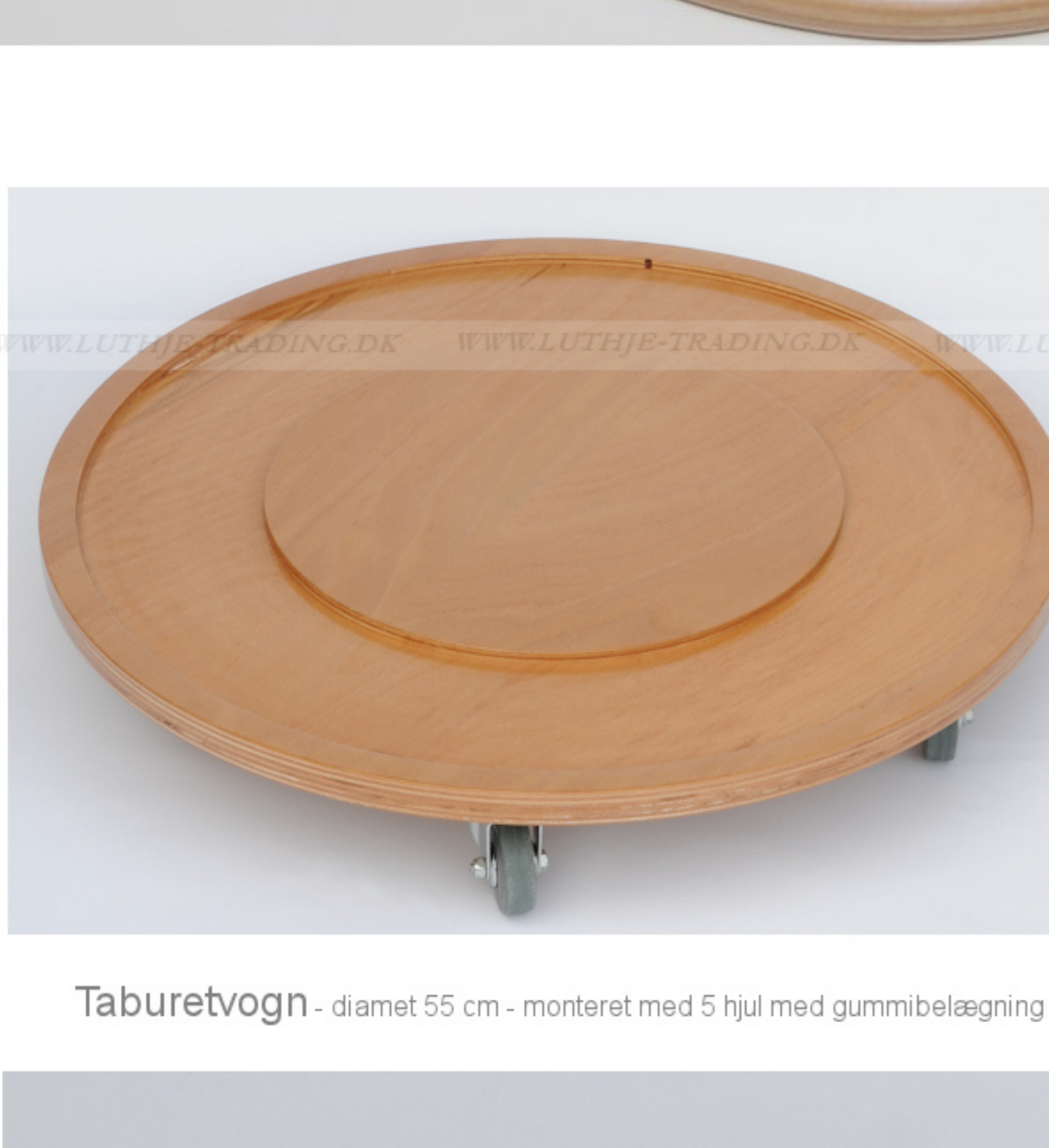
Taburetvoغن - diameter 55 cm - monteret med 5 hjul med gummi-belægning

Stellet er helsvæjset og bliver derved "knirkefrit"