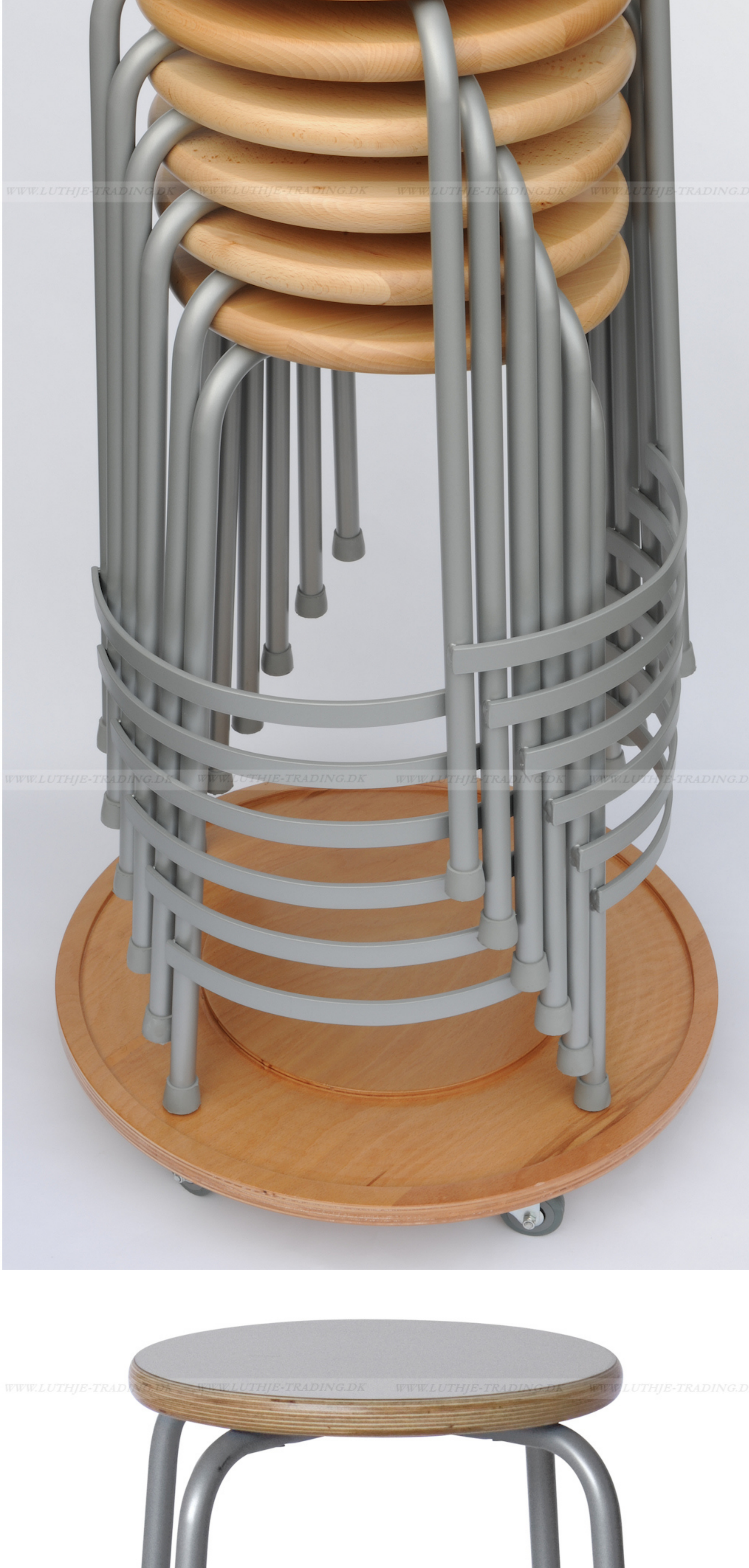
Silent taburet med 4 fodhviler