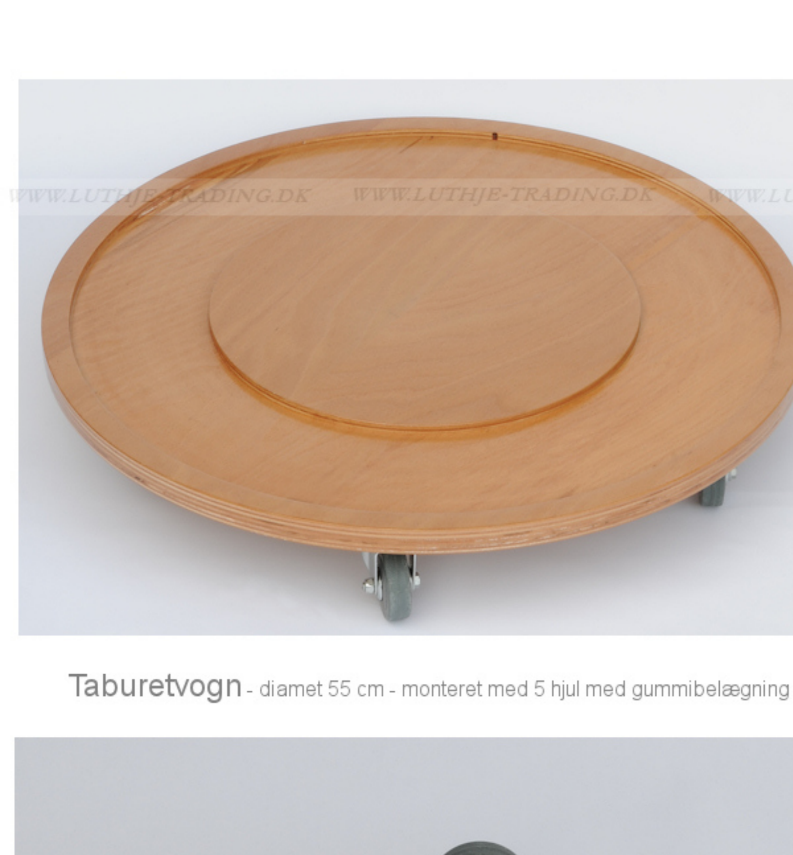
Taburetvoan - diameter 55 cm - monteret med 5 hjul med gummi-belægning

Stellet er helsvæjet og bliver derved "knirkefrit"