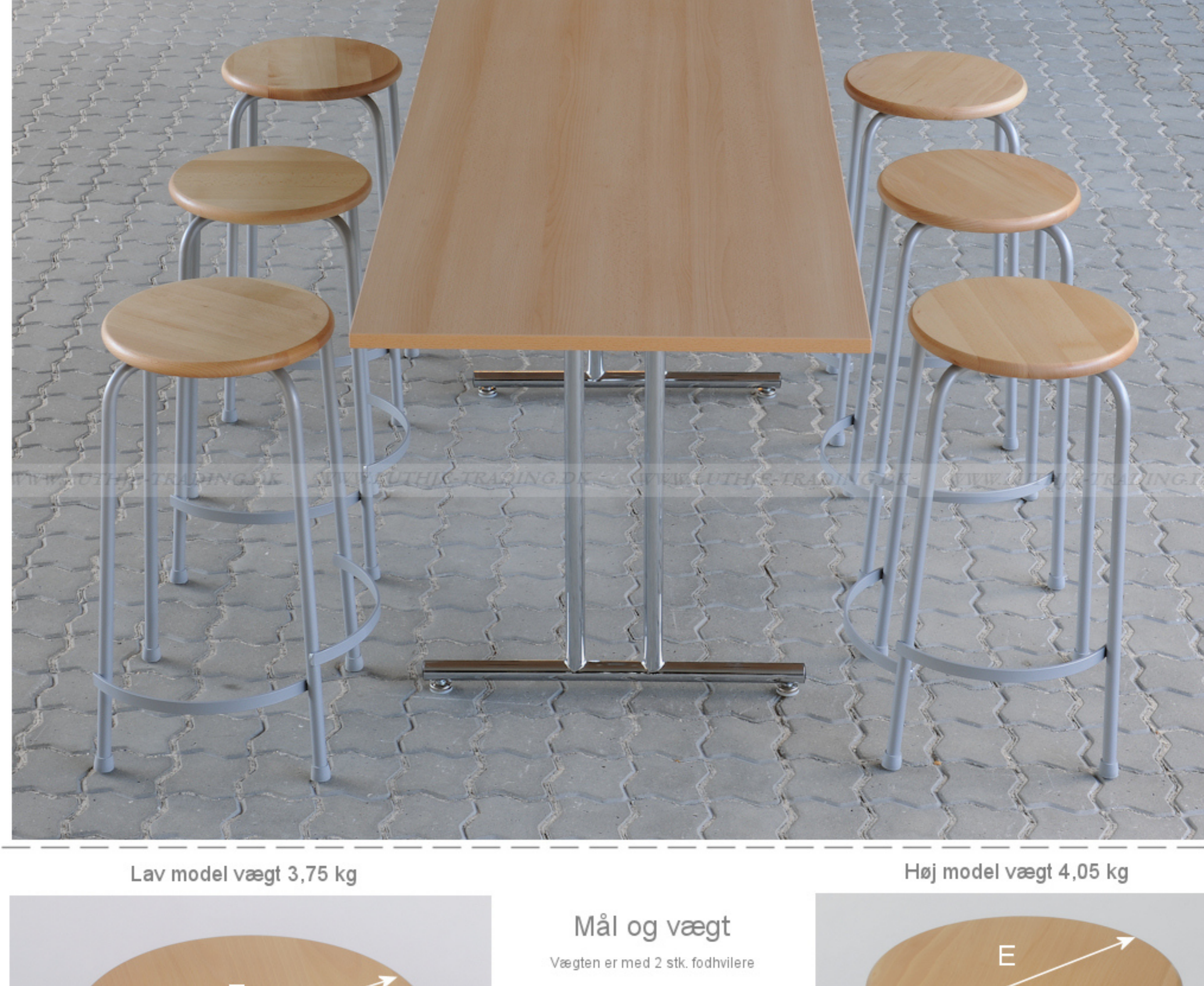
Lav model vægt 3,75 kg