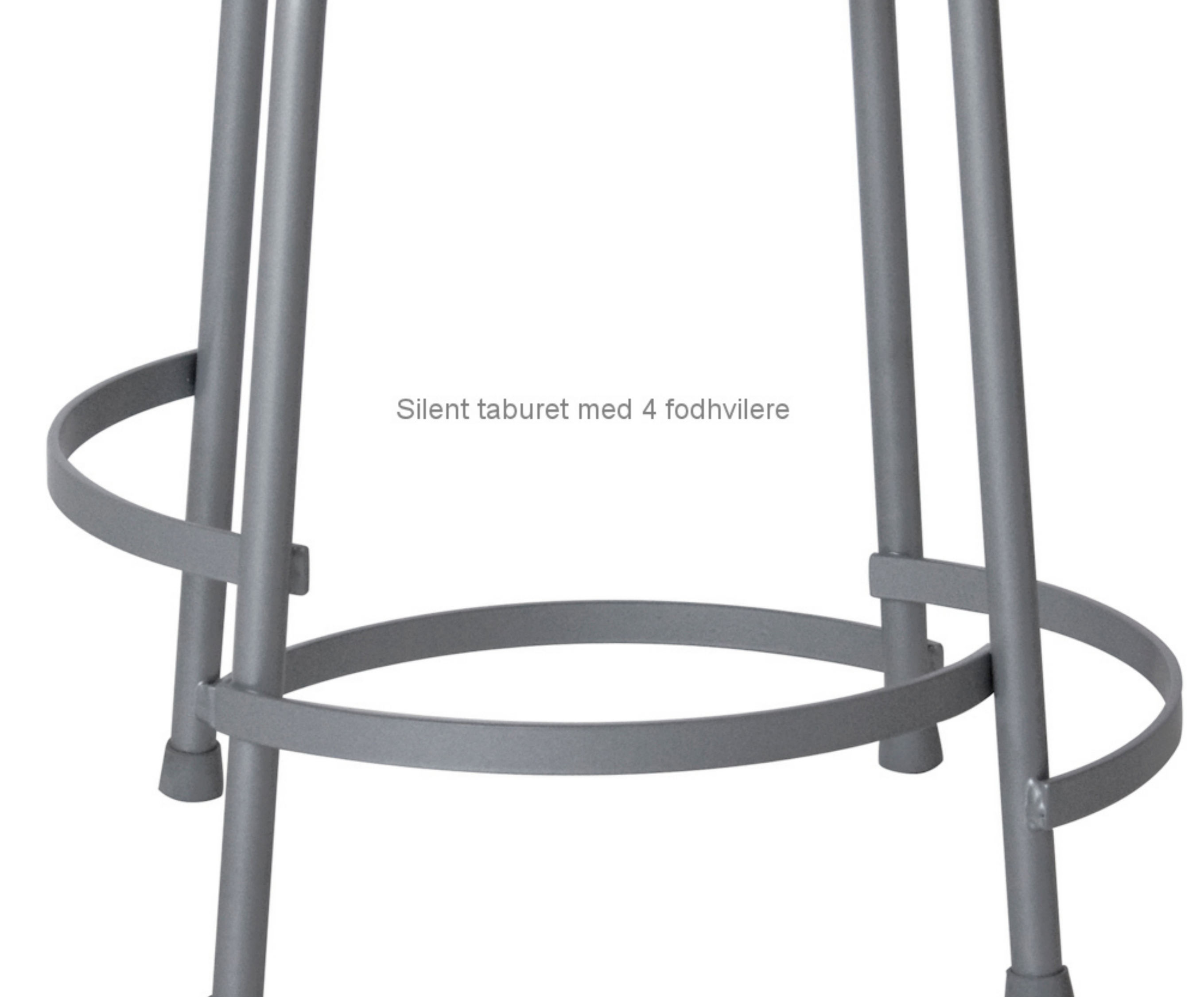
Silent taburet med 4 fodhviler