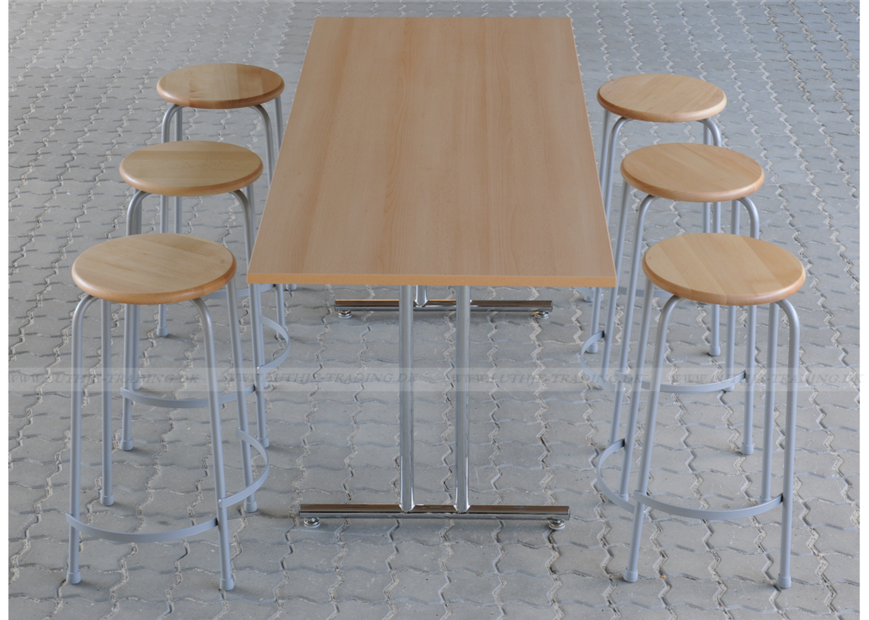
Lav model vægt 3,75 kg Høj model vægt 4,05 kg